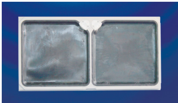
Horizontale Membrankammerplatte 2000 x 1000 mm Ansicht der Membranen