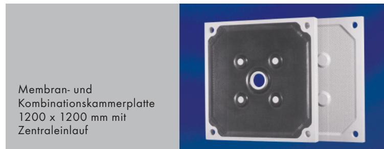
Membran- und Kombinationskammerplatte 1200 x 1200 mm mit Zentraleinlauf